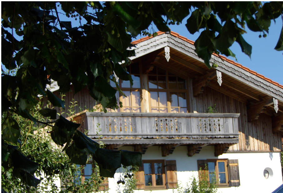
Ferienwohnung im DG

Wir haben einen großen Garten mit vielen Obstbäumen, Spielwiese, Tischtennisplatte und einen Grillplatz mit Sitzgelegenheit.