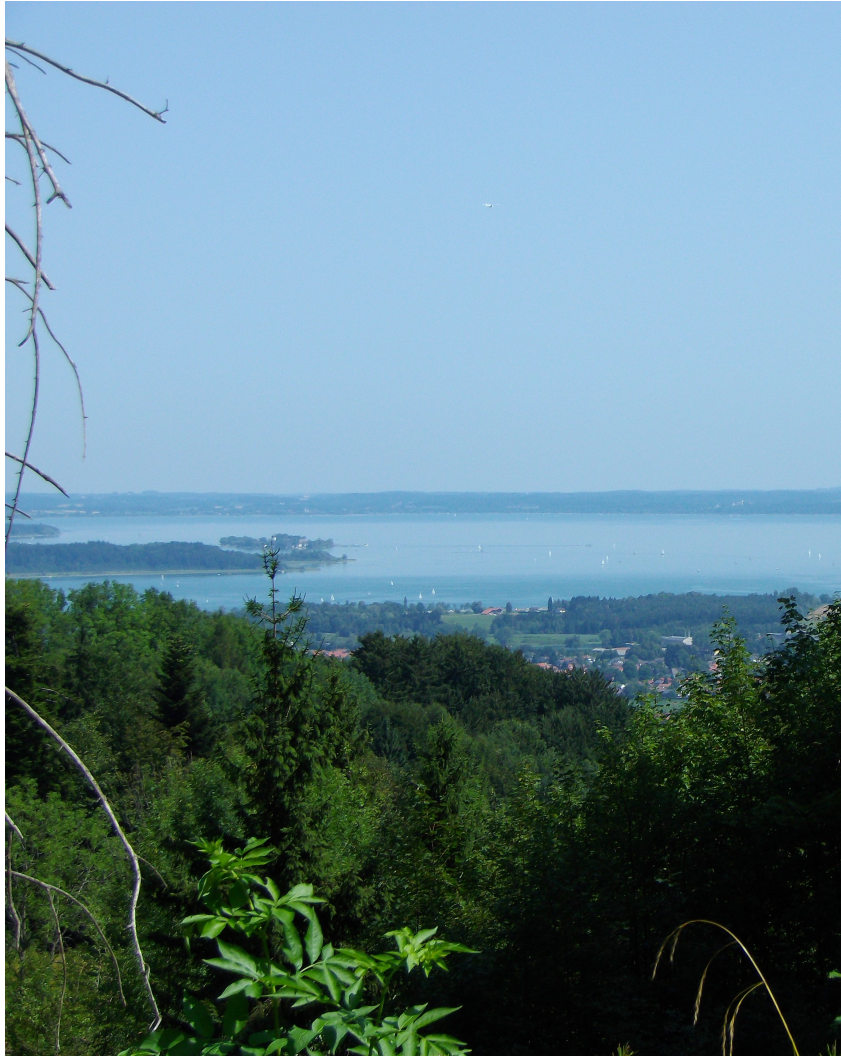
Chiemsee von „oben“

Herzlich willkommen in Übersee am Chiemsee