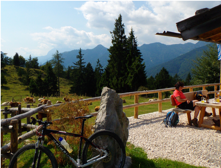
Auf der Alm

Die Gemeinde Übersee liegt zwischen dem Südufer des Chiemsees und den Chiemgauer Bergen und ist damit ein idealer Ausgangspunkt für Ihre Unternehmungen.